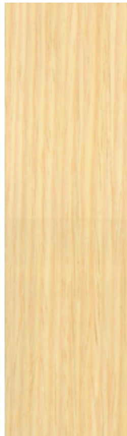
401 Trasparente / Transparent